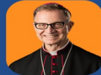
Obispo Edward Deliman

SÁBADO, 28 DE FEBRERO 2026 DE 9 AM A 5 PM